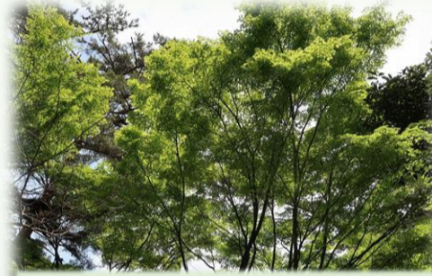
目に青葉、ホトドキスはまだ..