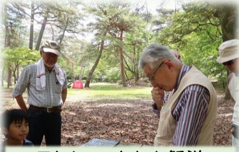
Tさんのこなれた解説