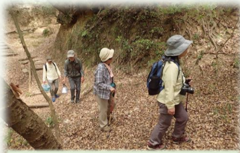
乾燥した大地を歩く

今回、カンゾウタケ初観察で、初めて食します。図鑑など調べ、スライスしオリーブオイルで焼いてみました。見た目は厚切り牛タン。口にしてみると、シャキシャキした歯ごたえがよいが、牛タンではない。見た目と食感が違いちょっと頭が混乱している感じです。味はあまりない?遅れてわずかな酸味がやってきました。酸味が強いと思っていたのですが、あまりありませんでした。肉が白かったからあまり成熟していなかったのか?味オンチか?次回は血の滴るようなのにトライしてみようかと思えます。まだ食されていない方も機会があれば是非!