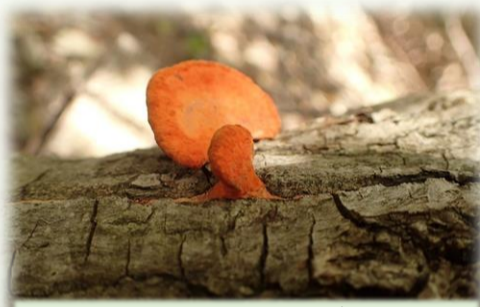
乾燥へっちゃら勢2