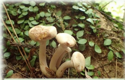
乾燥へっちゃら勢1