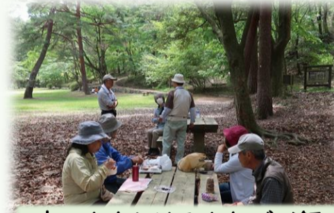
歩いたあとはみんなでご飯