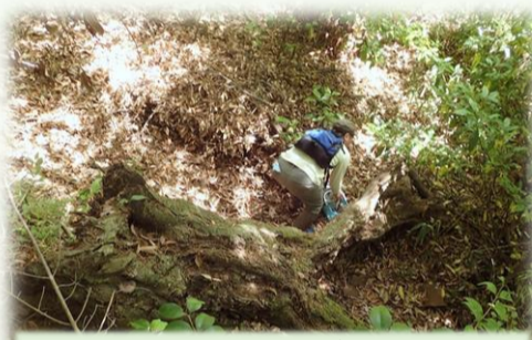
どんなどころも突き進む