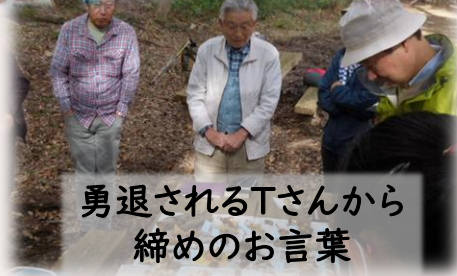
勇退されるTさんから締めのお言葉